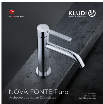
Beispiel Anzeige Broschüre 2022