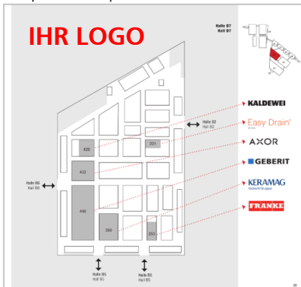
Beispiel Hallenplan Broschüre 2018